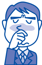
アレルギー性鼻炎・花粉症