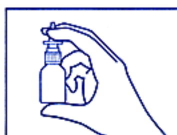
2. 上図のように容器を持ってください