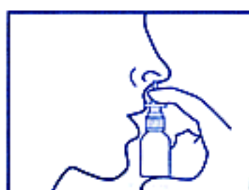
3. ノズルを軽く鼻腔内に入れ、静かに息を吸いこみながら、フックを押してください

*ノズルを下方に向けて使用しないでください *使用後はノズルを清潔なティッシュペーパー等でふき、キャップをして保管してください