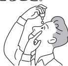
容器の先が目、まぶた、まつ毛に ふれないように