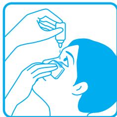
容器の先と目やまつ毛がふれることのないように