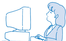
・OA機器をよく使用する