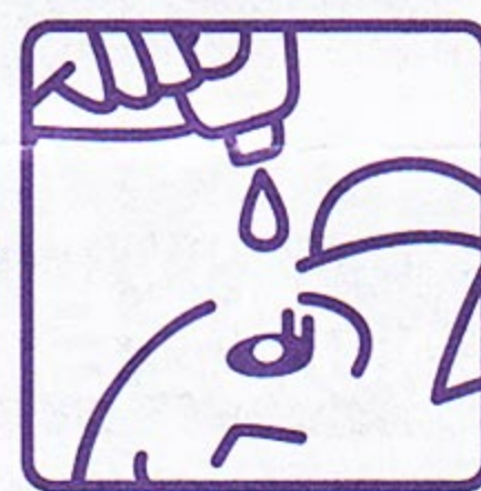
容器の先と目やまつ毛がふれることのないように