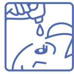
容器の先と目やまつ毛がふれることのないように