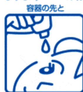
目やまつ毛が ふれることのないように