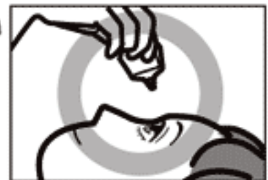
容器の先を下に向けて点眼