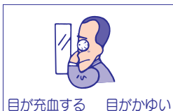
目が充血する 目がかゆい