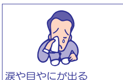
涙や目やにが出る