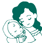
病後・産後の脱毛