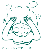
シャンプー& コンディショナー