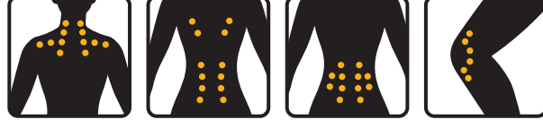
首・肩・肩甲骨に 肩甲骨・腰に 腰に ひざに