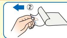
患部に貼りながら②のライナーをはがしてください