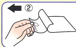
患部に貼りながら②のフィルムをはがしてください