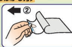
患部に貼りながら②のライナーをはがしてください