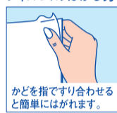
かどを指ですり合わせる と簡単にはがれます。