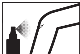
転んですりむいた時