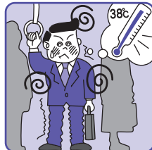
かぜ等の発熱で体力を消耗している時の栄養補給に