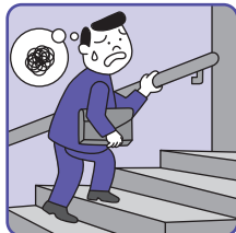
疲れがたまり、無理がきかなくなってきたと感じる方の栄養補給に