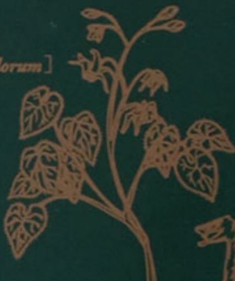
蛇床子 [Cnidium monnieri]