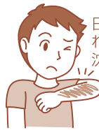
日やけ・かぶれによる色素沈着