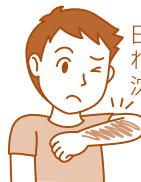
日焼け・かぶれによる色素沈着