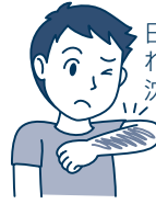
日やけ・かぶれによる色素沈着