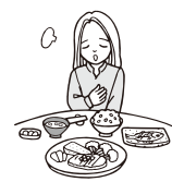
食欲不振 (食欲減退)