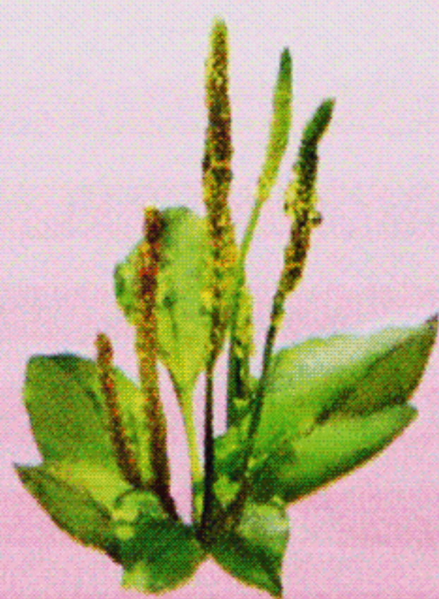
プラントゴオバタ