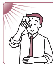
胃のもたれ、 胃部不快感