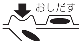
<PTPシートの取り出し図>

(誤ってPTPシートをそのまま飲み込んだりすると食道粘膜に突き刺さる等思わぬ事故につながります。)